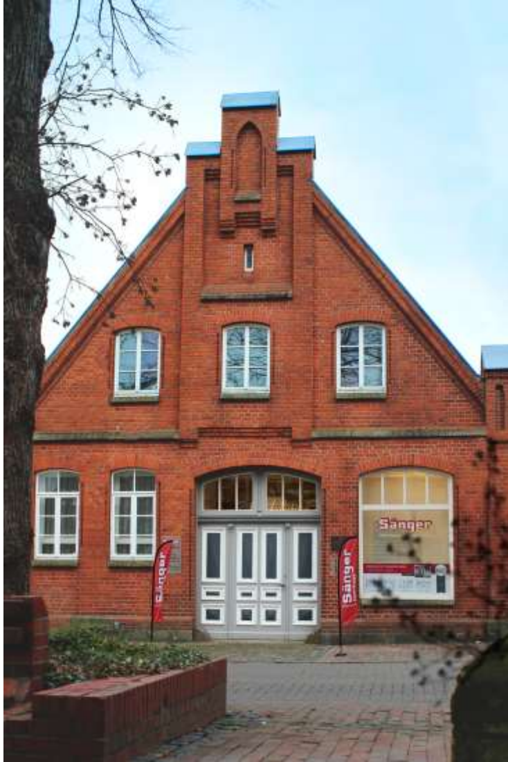
Büro in der Schloßstraße 3 in 31535 Neustadt